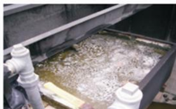
Programa dual de bioaumentación Microclear 207 y Microclear 100