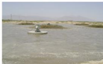
56 días de aplicación de Microclear 205, en la laguna claramente se observa que la grasa desapareció