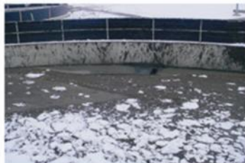
Problemas con bajas temperaturas