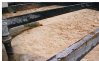
Problemas de grasas, aceites, DBO