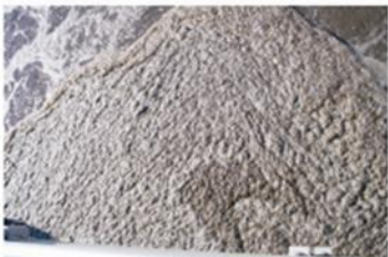
Problemas con altas grasas, DBO, grasas y aceites