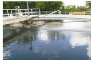
Programa dual de bioaumentación diaria Microclear 205 y Microclear 100