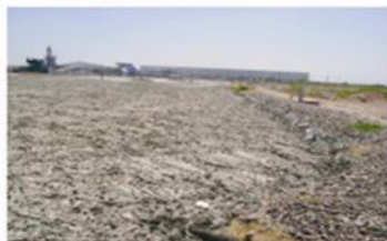
Problemas de saturación de lodos, grasa, DBO