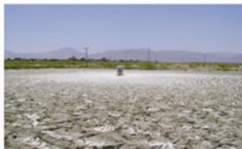
30 Días después de la aplicación del producto Microclear 205