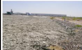
Problemas de saturación de lodos, grasa, DBO