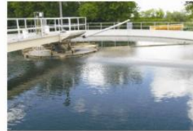
Programa dual de bioaumentación diaria Microclear 205 y Microclear 100