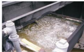
Programa dual de bioaumentación Microclear 207 y Microclear 100