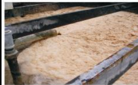
Problemas de grasas, aceites, DBO