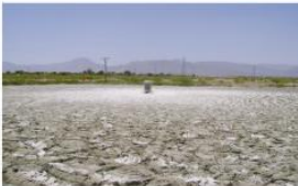
30 Días después de la aplicación del producto Microclear 205