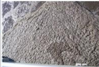
Problemas con altas grasas