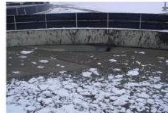
Problemas con altas grasas