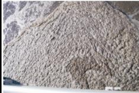
Problemas con altas grasas, DBO, grasas y aceites