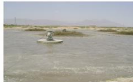
56 días de aplicación de Microclear 205, en la laguna claramente se observa que la grasa desapareció