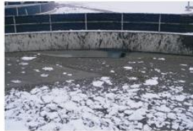
Problemas con bajas temperaturas