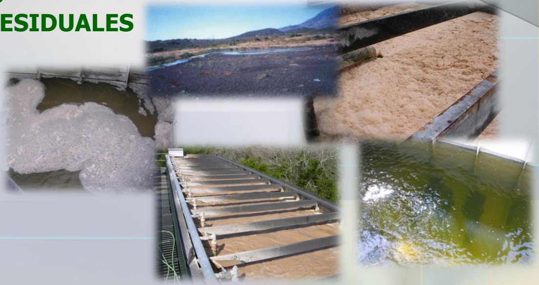
Planta de Tratamiento Municipal

En los productos biológicos Environmental operadores de plantas tratadoras han encontrado una solución costo efectiva para asegurar el mejor funcionamiento de las plantas que están operando.