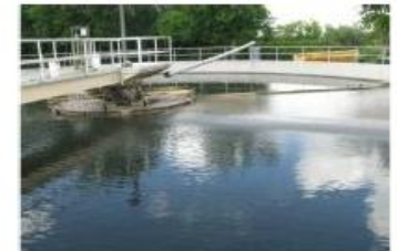
Programa dual de bioaumentación diario