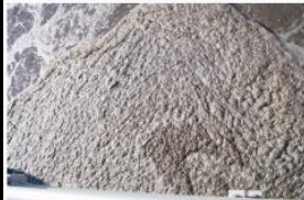
Problemas con altas grasas, DBO, grasas y aceites