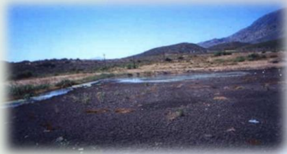
Aplicación M205 a una semana