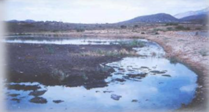
Aplicación M205 a dos semanas