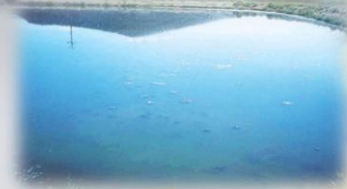
Aplicación M205 a doce semanas