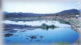
Aplicación M205 a seis semanas