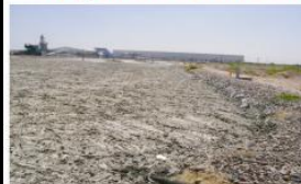
Problemas de saturación de lodos, grasa, DBO