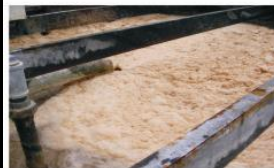
Problemas de grasas, aceites, DBO