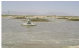
56 días de aplicación de Microclear 205, en la laguna claramente se observa que la grasa desapareció