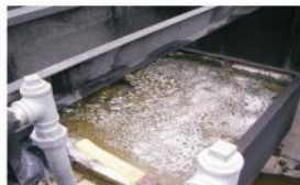
Programa dual de bioaumentación Microclear 207 y Microclear 100