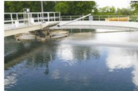
Programa dual de bioaumentación diaria Microclear 205 y Microclear 100