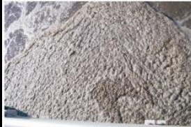
Problemas con altas grasas, DBO, grasas y aceites