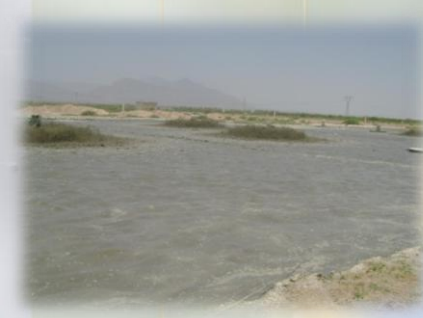
Foto a los 56 dias de aplicación M205 sin grasa