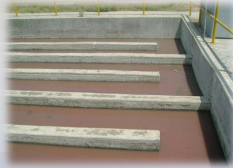
Foto a los 56 dias de agregar M205 sin grasa