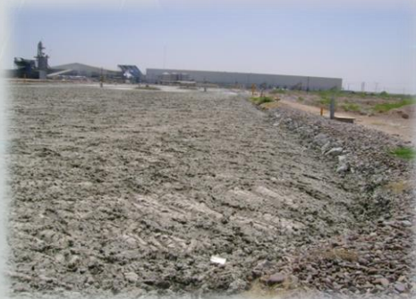
Sin tratamiento Biológico Exceso de grasa acumulada