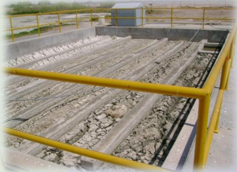
Sin tratamiento Biológico Exceso de grasa acumulada