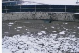
Problemas con bajas temperaturas