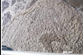
Problemas con altas grasas, DBO, grasas y aceites