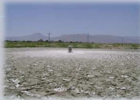
Foto a los 30 dias de aplicación M205