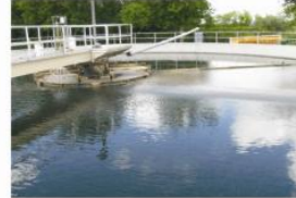
Programa dual de bioaumentación diaria Microclear 205 y Microclear 100