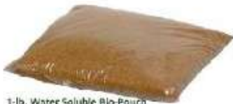
1-lb. Water Soluble Bio-Pouch