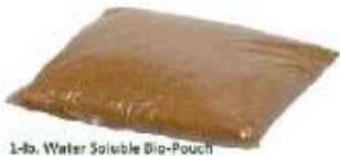
1-lb. Water Soluble Dip-Pouch